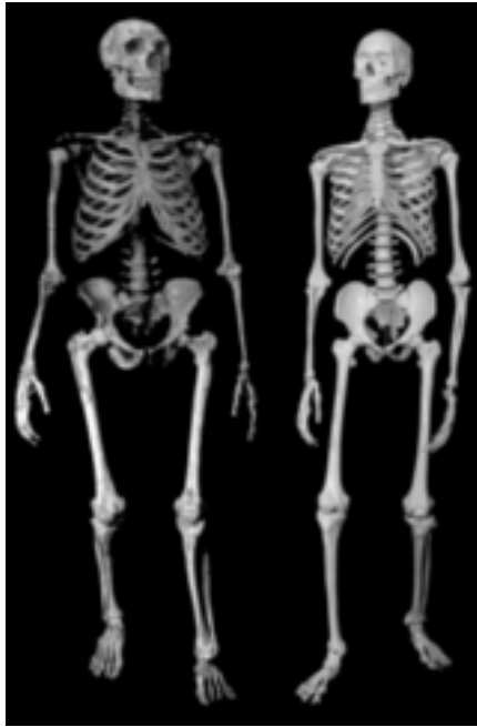
Abb. 1.1: Das rekonstruierte Skelett eines Neandertalers (links) und eines heutigen Menschen (rechts).

eine noch größere Überraschung bereithielt. Die Neandertaler sind die engsten ausgestorbenen Verwandten der heutigen Menschen. Wenn wir ihre DNA analysieren konnten, würden wir zweifellos feststellen, dass ihre Gene den unseren sehr ähnlich waren. Einige Jahre zuvor hatte meine Arbeitsgruppe zahlreiche DNA-Fragmente aus dem Schimpansen genom sequenziert und damit nachgewiesen, dass sich in den DNA-Sequenzen, die wir mit den Schimpansen gemeinsam haben, nur etwas mehr als ein Prozent der Nucleotide unterscheiden. Die Neandertaler mussten uns natürlich noch viel näher stehen. Aber – und das war ungeheuer spannend – unter den wenigen Abweichungen, mit denen wir im Neandertalergenom rechneten, mussten genau jene